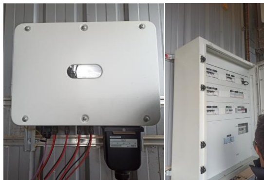
Połączenie falownika i rozdzielnic.