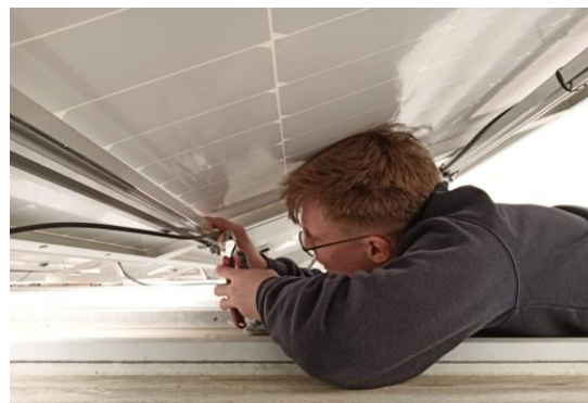
Łączenie paneli fotowoltaicznych w stringi.