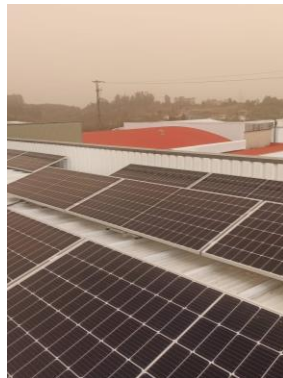
Mocowanie paneli fotowoltaicznych na uchwytach.